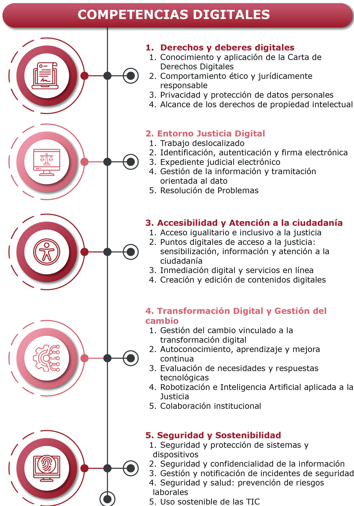
Ilustración 2. Competencias por área

A su vez, cada área competencial aglutina una serie de competencias relacionadas con ese ámbito concreto, hasta configurar un marco completo compuesto de un total de 23 competencias digitales para la formación del personal de justicia.