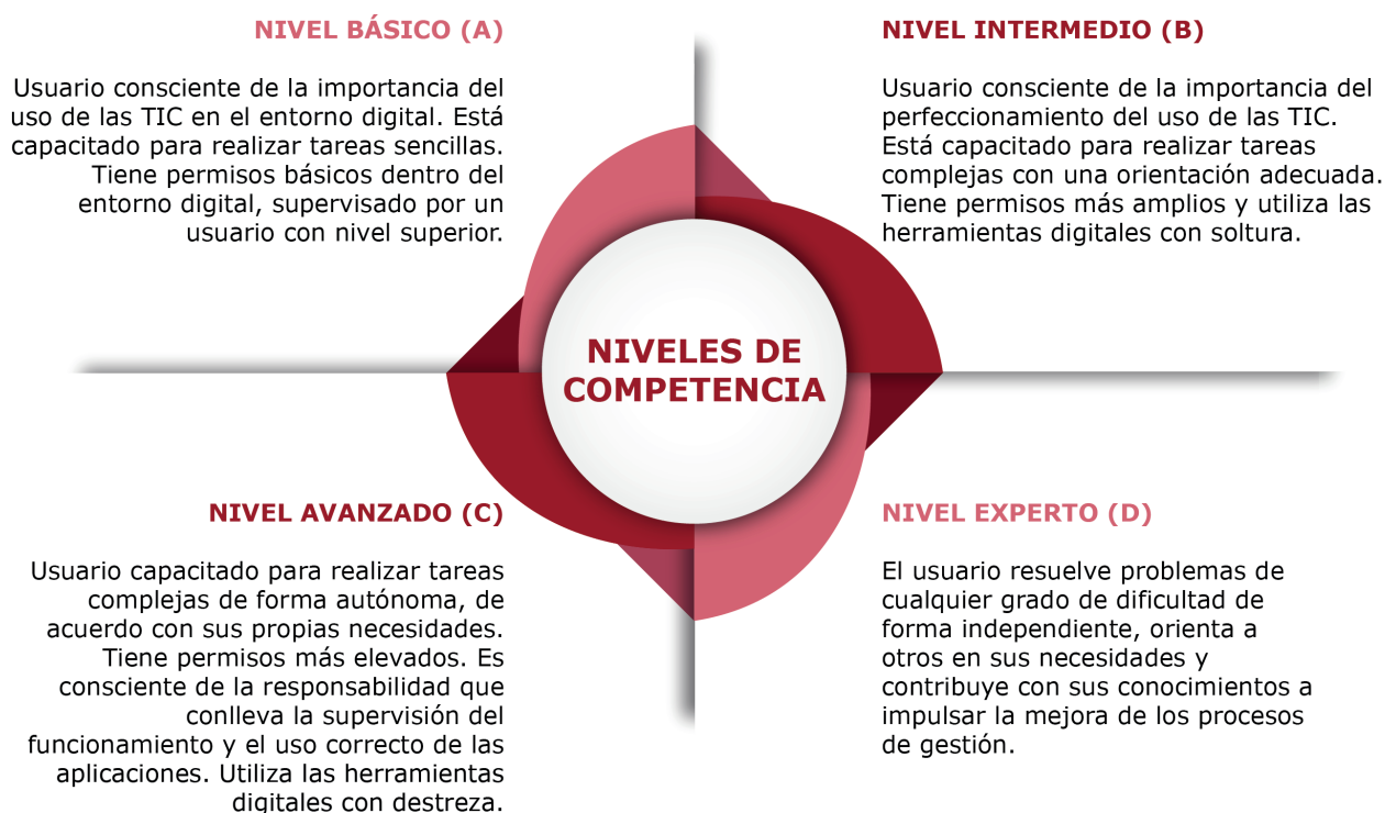
Ilustración 3. Niveles de competencia

Los niveles competenciales son los siguientes: